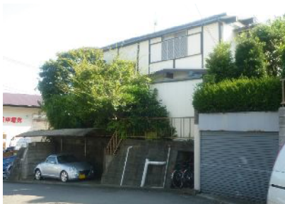
(例)B様邸:横浜市のお土地の施工事例