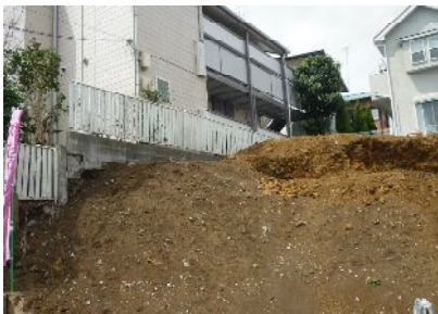
(例)A様邸:町田市のお土地の施工事例