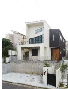
▶ 高低差が大きな土地を利用して、各部屋をスキップで繋いだ設計。