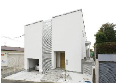
▶ 古い建物と擁壁を解体し、玄関やビルトインガレージを道路からフラットにアクセスできるような設計。